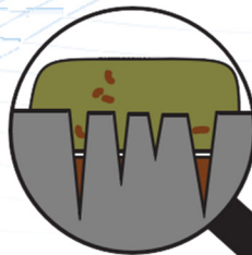
Niisutamine „tavaliste“ puhastusvahenditega.